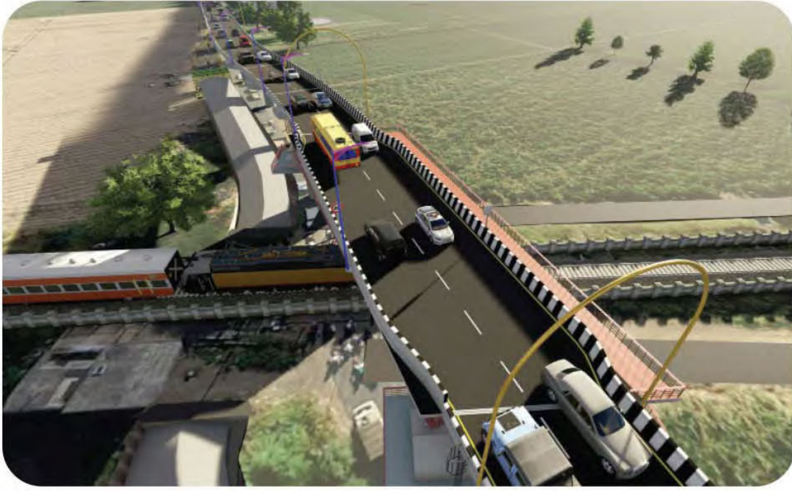
भिलवडी-नांदे विभागातील भिलवडी-नांदे स्थानकांदरम्यान एलसी - ११९ वरील उड्डाणपूल