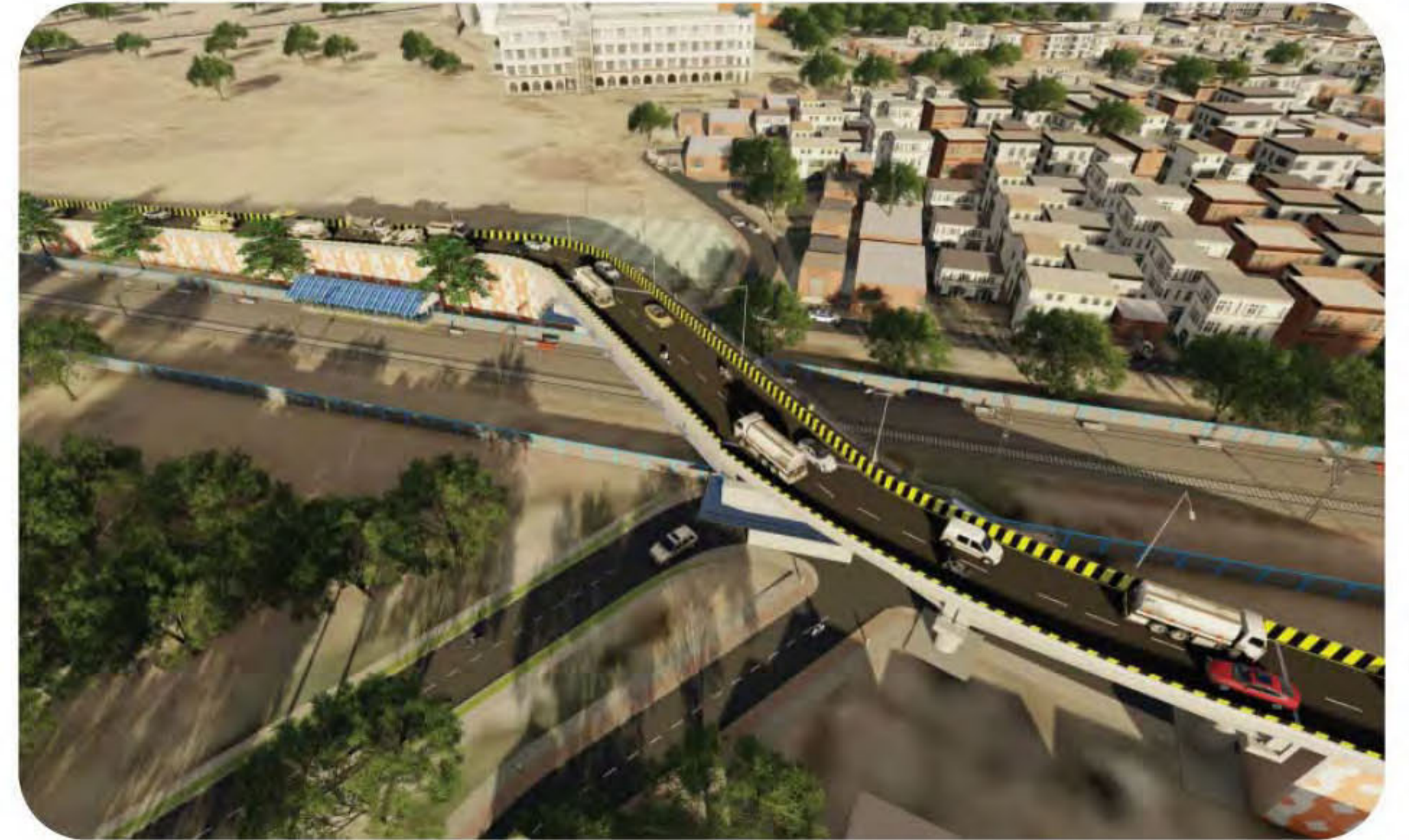
नागपूर-बल्लारशाह विभागातील मालखेड व चांदूर स्थानकांदरम्यान एलसी ६९ वरील उड्डाणपूल