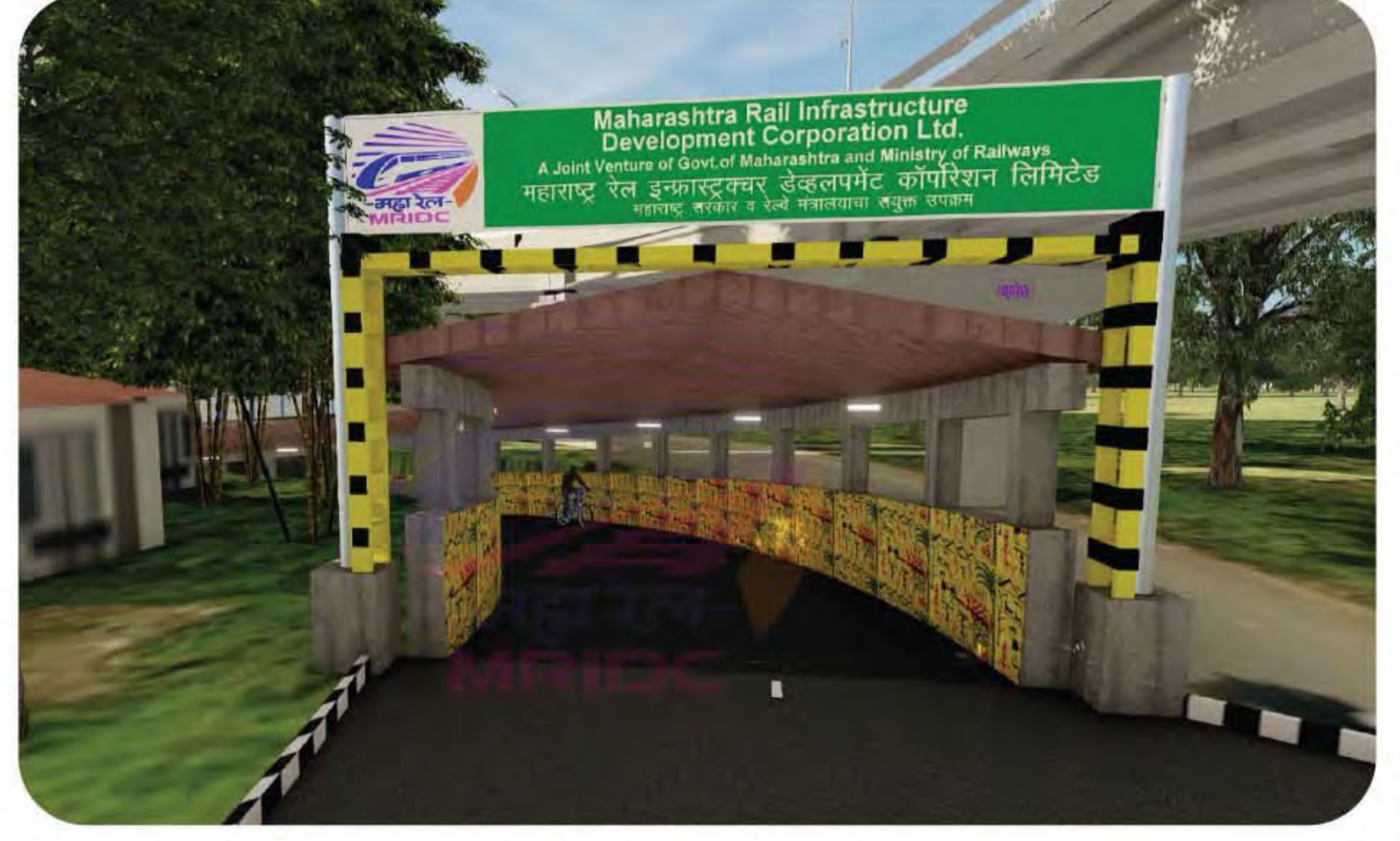
आमला-नागपूर विभागातील कोहली व कमलेश्वर दरम्यान एलसी - २८८ येथील भुयारी मार्ग व उड्डाणपूल