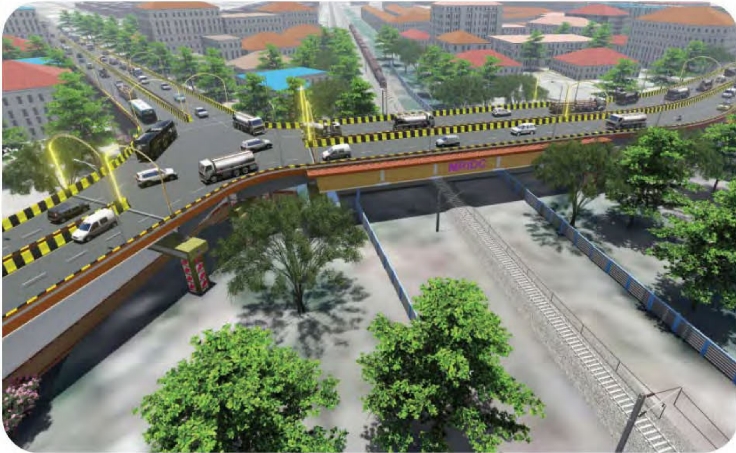
इतवारी-नागभिड रेल्वे लाईन वरील कलमना मार्केट व नागपूर शहराला जोडणारा एलसी ७३ येथील उड्डाणपूल