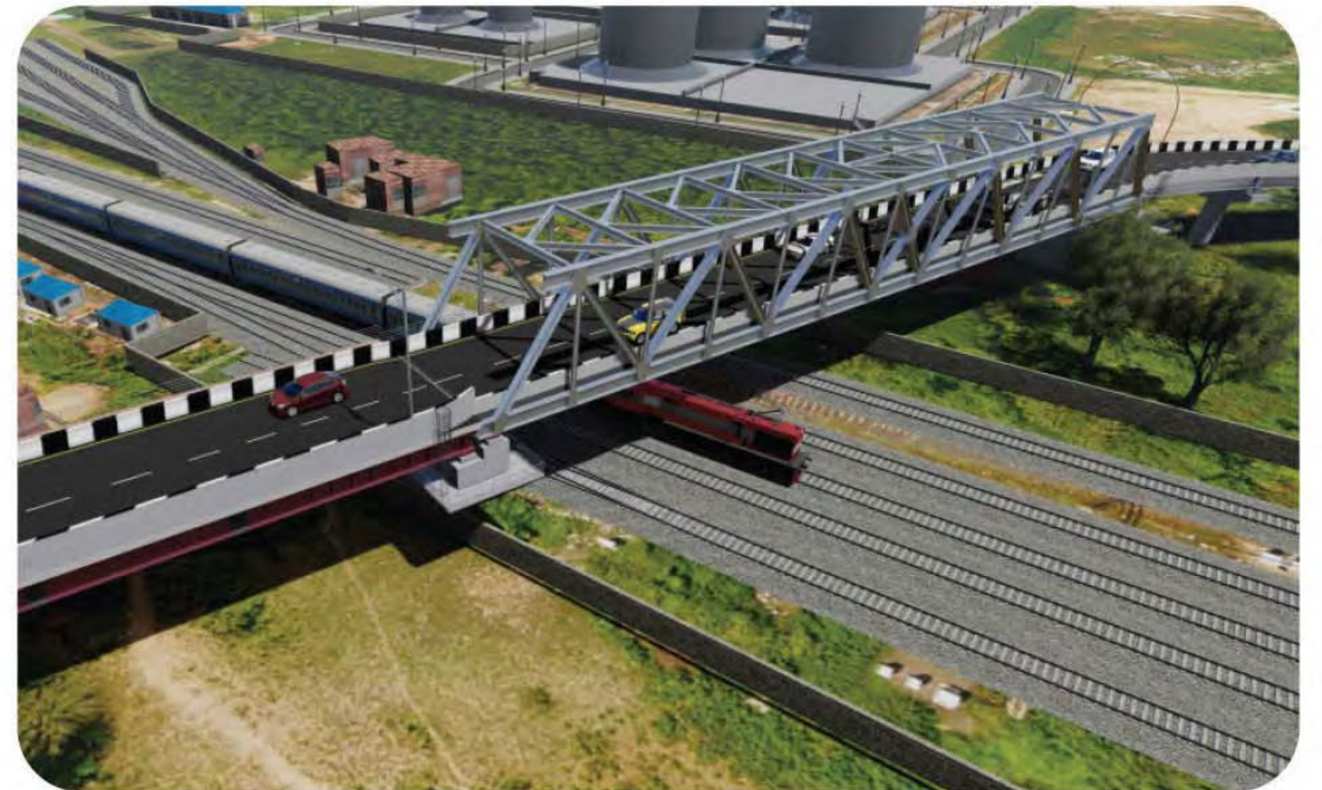
नागपूर-वर्धा विभागातील बुटीबुरी व सिंधी स्थानकांदरम्यान एलसी १०८ येथील उड्डाणपूल