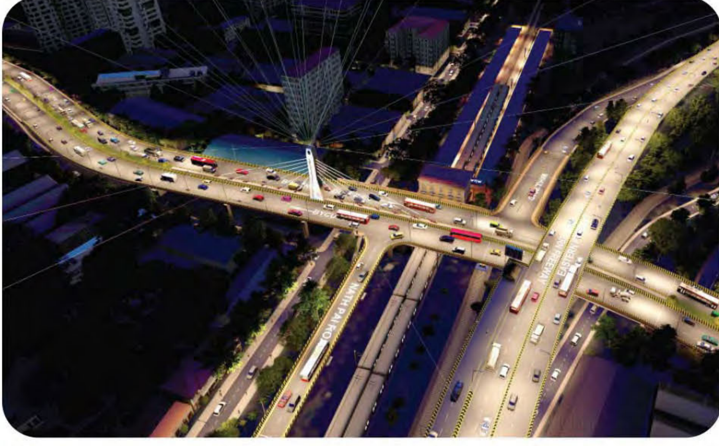
भायखला, मुंबई येथे भायखला आणि सँडहर्सट रोड रेल्वे स्टेशन दरम्यान केबल स्टेड ब्रिजचे रात्रीचे दृश्य