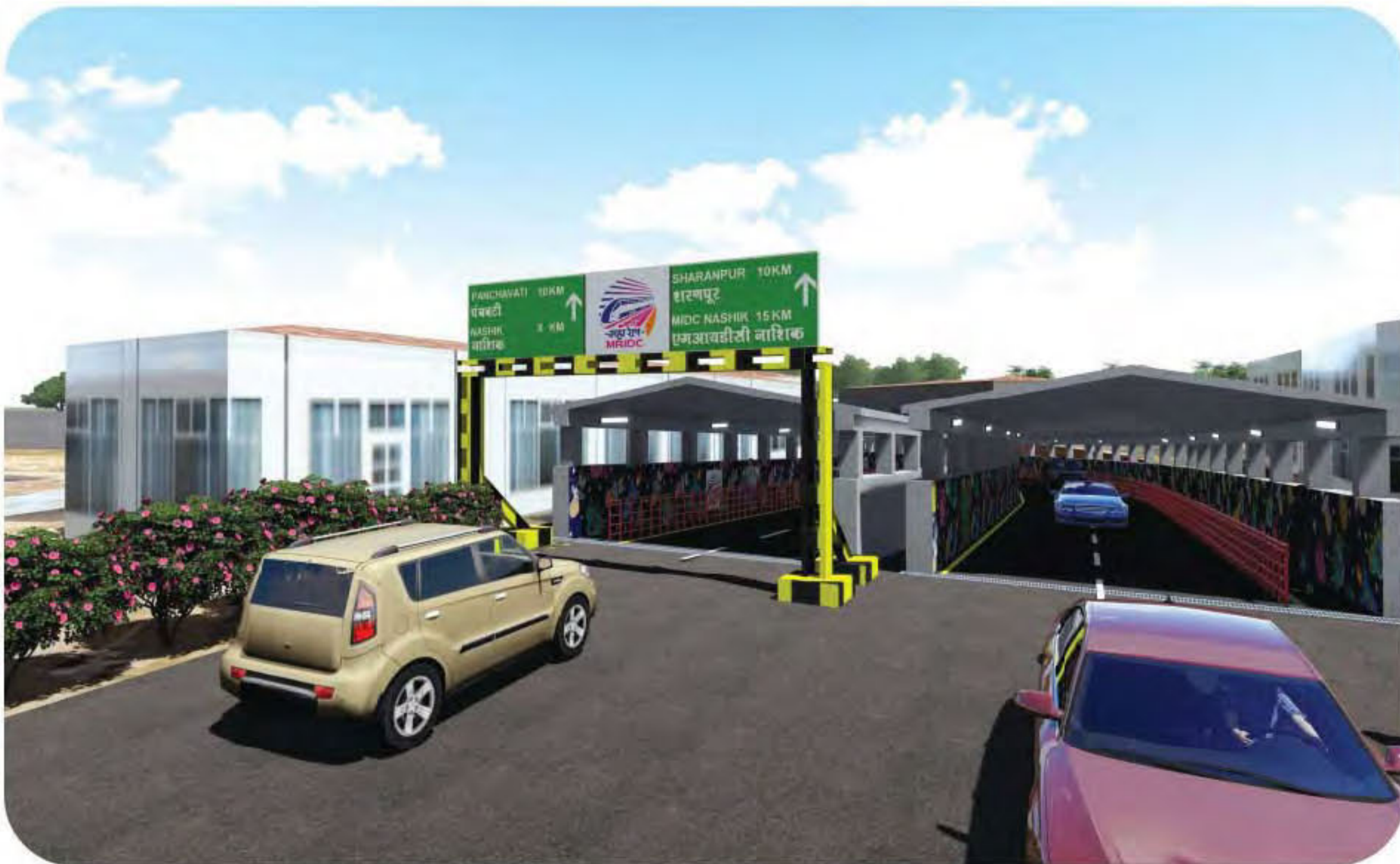
इगतपूरी-भूसावल विभागातील नाशिक रोड व ओढा स्थानकांदरम्यान एलसी ९० येथील भुयारी मार्ग